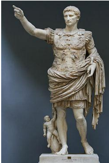
Statua de Julius Cæsar

Iste esseva le plus cruel sectura de totes, nam, quando le nobile Cesare le videva pugnalar, ingratitude, plus forte quam le armas perfide, completamente le vinceva. Alora su forte corde se disrumpeva; e in su mantello involvente su visage, mesmo presso al base del statua de Pompei, que durante tote le tempore flueva sanguine, le grande Cesare cadeva !