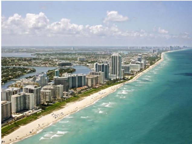
Miami – SUA